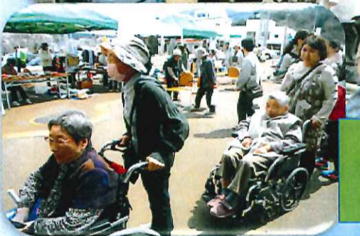
みのりの丘まつり ふれあい市場付き添い