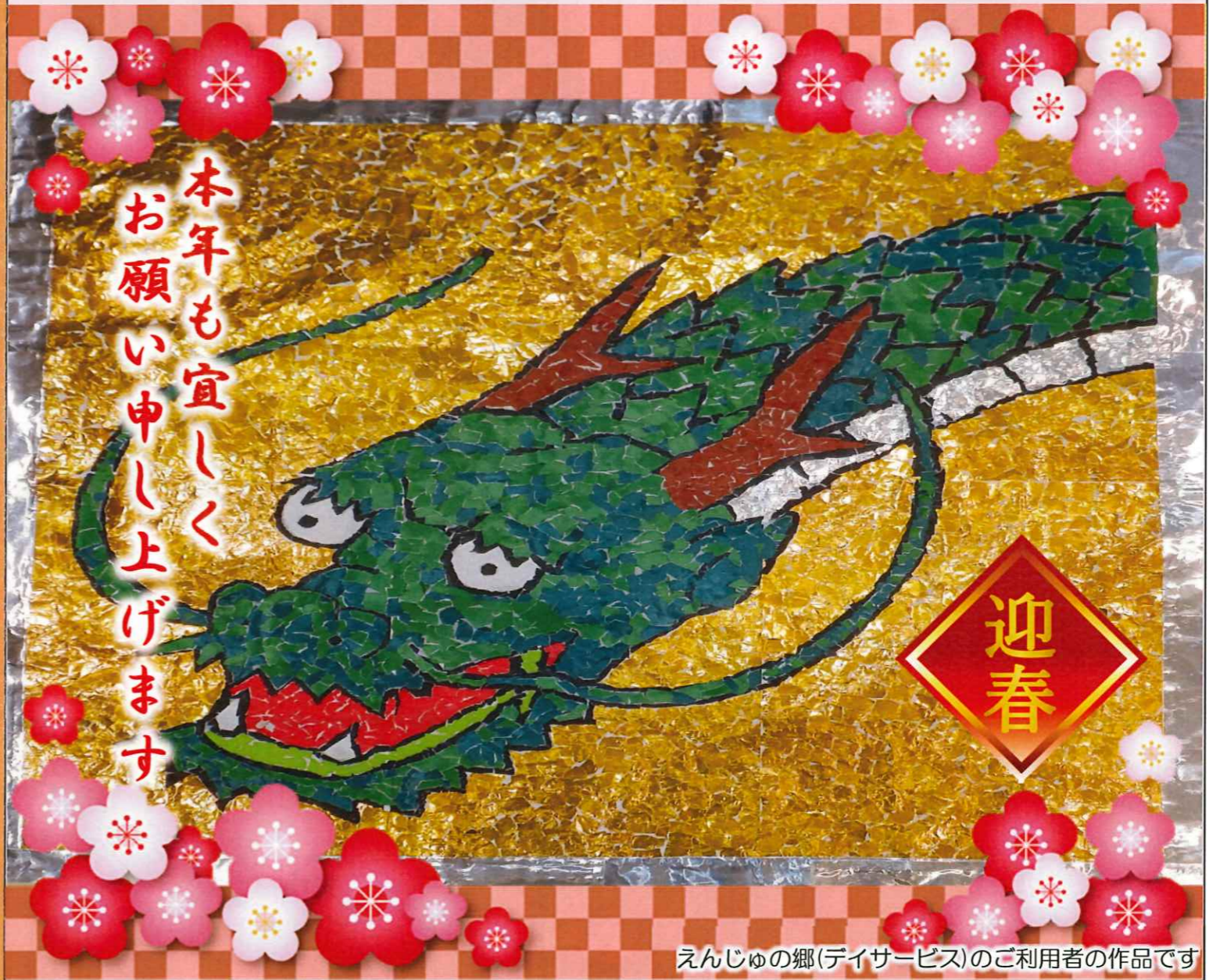
えんじゅの郷(デイサービス)のご利用者の作品です