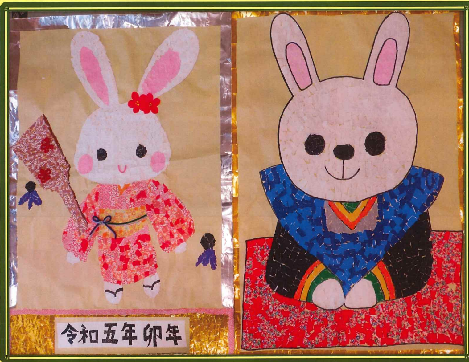
えんじゅの郷(デイサービス)のご利用者の作品です

★掲載している写真は、ご本人又はご家族の了承をいただいております。ご厚意に感謝申し上げます。 ★インターネットブログにて、みのりの丘の日々の様子を公開しております。ぜひ、ご覧ください。