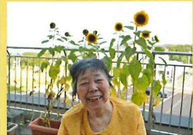
夏を待つ！ ひまわりが咲きました。