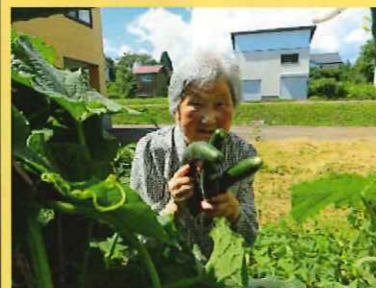
キュウリも 大きく育ちました。