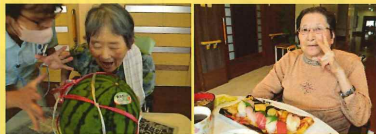
みんなでスイカを食べたよ！