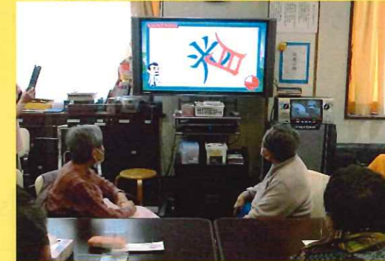
トータルヘルスサポートシステム を使って楽しく脳トレです。