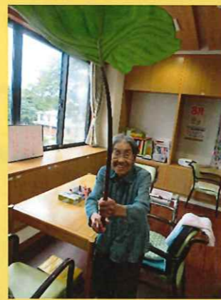
畑で採れたズイキです。 「でっかいね～」