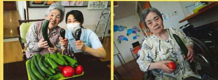
今年もたくさんの野菜が採れました！！