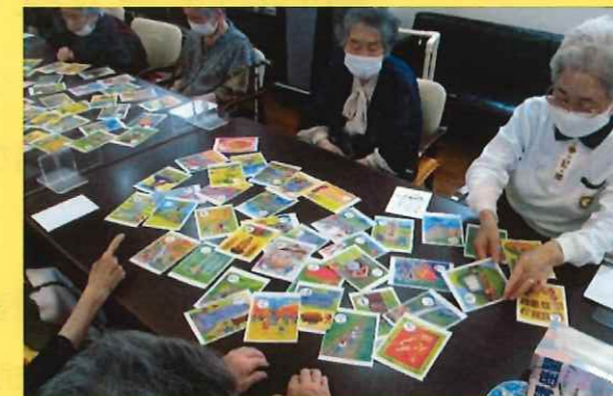
地域を題材に取り入れた妙高カルタ！ 地元ネタがいっぱいです。