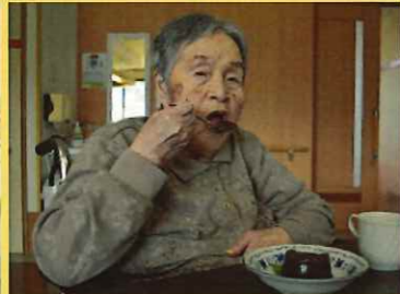
水羊羹は、冷たくておい しい！