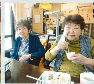
施設内行事として『お楽しみ屋台』を開催しました。屋台はどれも皆様に喜んで頂けました。