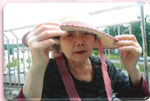
(左の写真) 天気の良い日にベランダに出てみました。外の空気はいいですね。