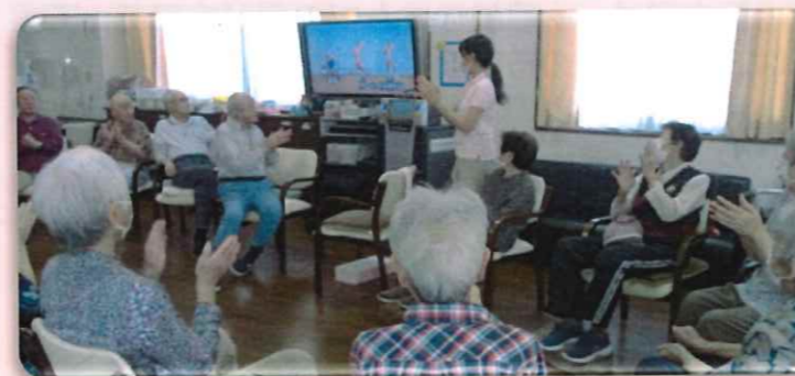
トータルヘルスサポートシステムを導入!

「より楽しく!より健康に!」を目指し、えんじゅの郷では、通信カラオケ機器を活用した、介護予防・健康増進コンテンツ配信システムを導入しました。音楽・体操・映像などのオリジナルプログラムを通じて、楽しい・面白いという体験を共有しながら心身に効果を実感していくことができます。豊富なコンテンツから、対象者や目的に合ったコンテンツを選び、介護予防や健康増進につながるような支援を広げて行きたいです。