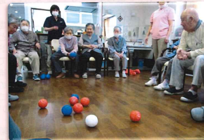
パラリンピックの正式種目でもある「ボッチャ」を行いました。初めはやったことない・・・ルールも知らない・・・と言う方が多かったですが、やるにつれて皆さんハマリです。やればやるほど深く楽しめるスポーツで、気分はアスリート。目指せ!パリですかね(*。^*)