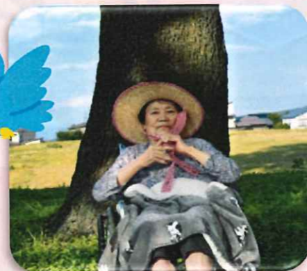
(左の写真) 晴れ晴れとした日に、園内を散歩しました。気持ちのいい風を感じながらリフレッシュした一日でした。