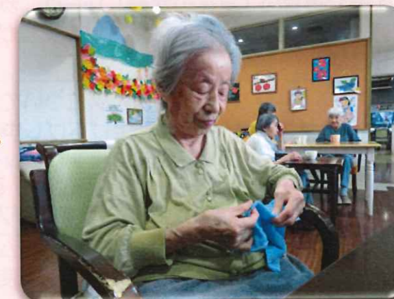
お針子さんたちは「ばあちゃん、いくらでもやんでね〜」と、雑巾縫いを頑張ってます。