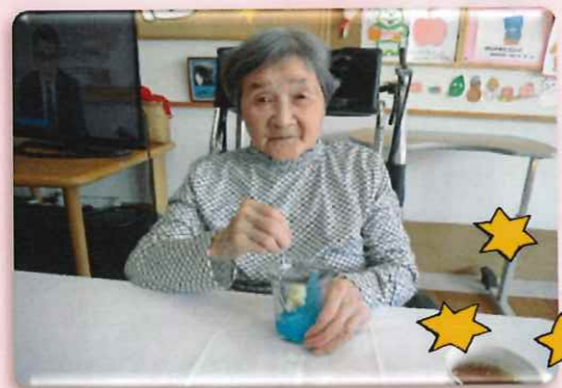
(下段の写真) 笹の節句に天の川をイメージして、七夕ゼリーを食べました。色鮮やかで味もおいしかったです。