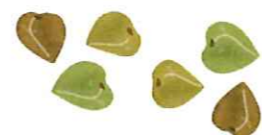
あすなろ ～グループホーム～