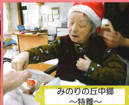
みのりの丘中郷 ～特養～