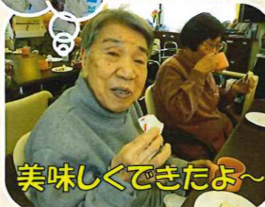
美味しくできたよ～

午後の活動で、サンドウィッチ作りを行ないました。皆さんとてもお上手で、最高のサンドウィッチが出来上がりました。