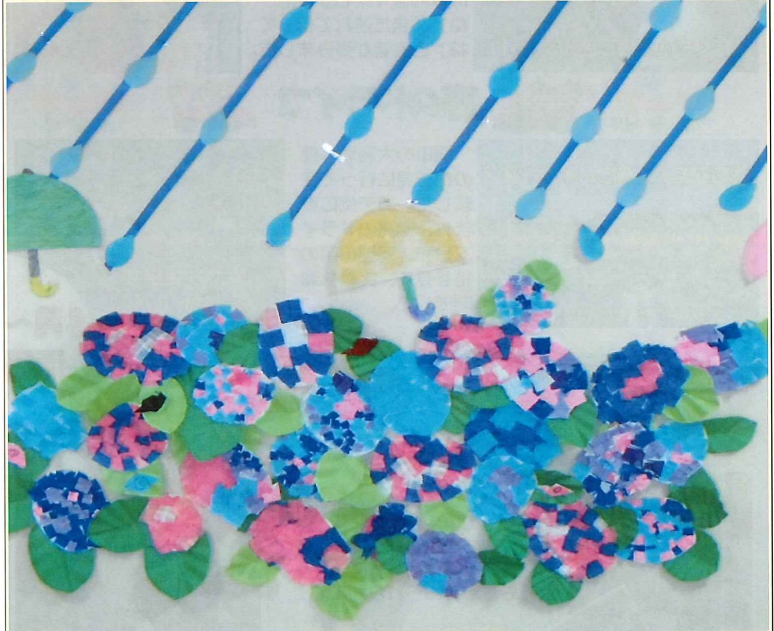
【紫陽花】作成：ほのぼの中郷利用者様