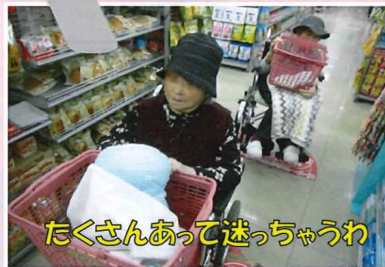
たくさんあって迷っちゃうわ

高田までドライブに行ってきました。皆さん、思い思いの買い物や外食ができて、とても喜んでいただき、帰りの車内は「楽しかったね」「また連れて行ってね」と会話が弾みました。