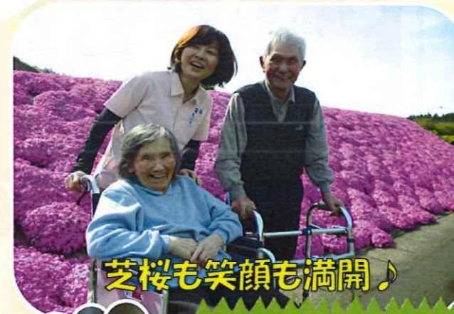
芝桜も笑顔も満開♪

えんじゅの郷では毎年恒例の新緑ドライブに、板倉区にあるやすらぎ荘へ芝桜を見に行きました。まぶしい日差しが芝桜の鮮やかなピンク色を照らし、春の新緑を満喫しました。