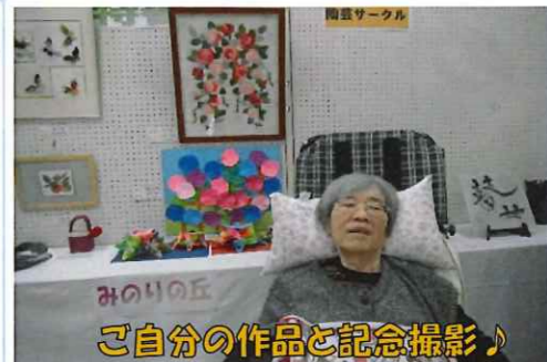
ご自分の作品と記念撮影♪