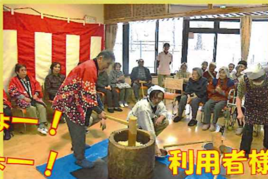
利用者様も熱心です！