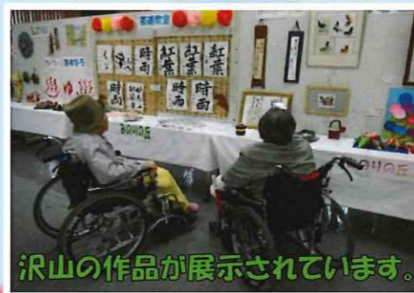
沢山の作品が展示されています。