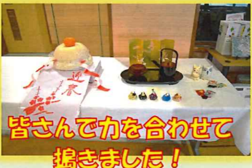
皆さんで力を合わせて搗きました！