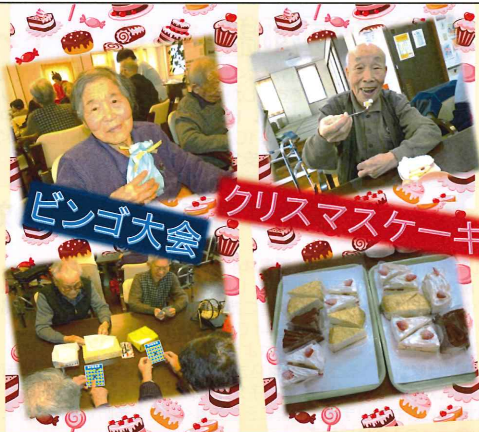
ビンゴ大会 クリスマスケーキ