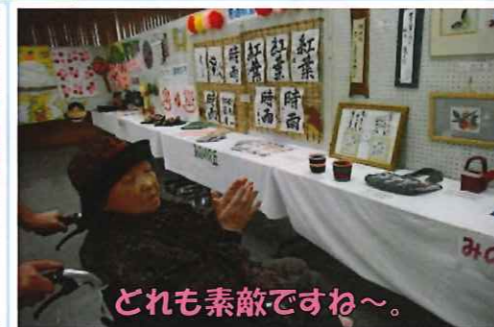
どれも素敵ですね～