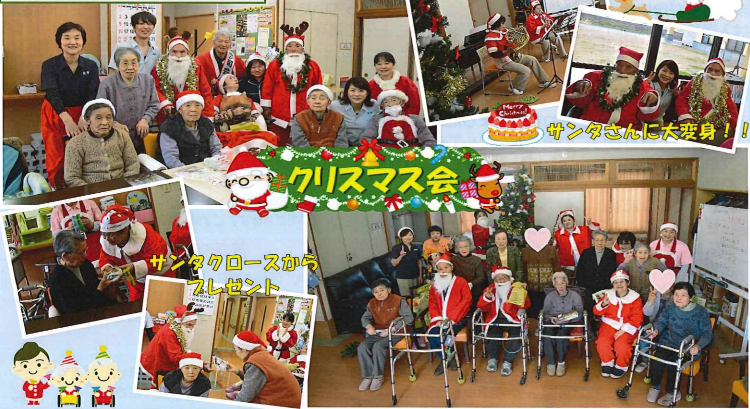
職員によるミニコンサート