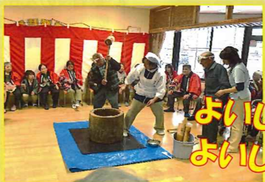
よいしょー！ よいしょー！