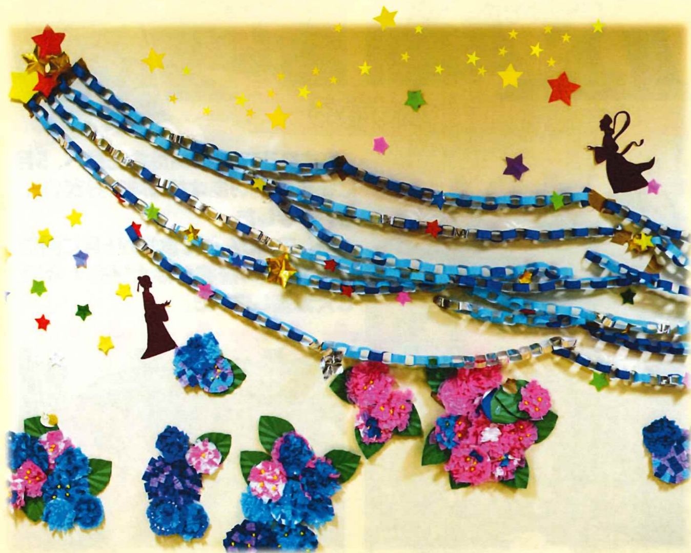
地域交流スペース壁画より。 ほのぼの中郷のご利用者の方のご協力により作成致しました。