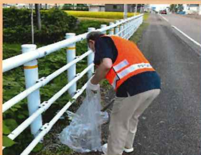
クリーンパートナー 小さな助っ人がお手伝い。 とっても、助かりました。