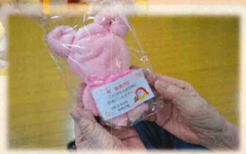
職員みんなでクマを折りプレ ゼントしました