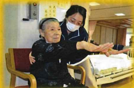
腕の筋カトレーニング

*『私もやってみたいわ』『専門の先生にみてもらいたいなあ』という方は、ぜひお声掛け下さい。