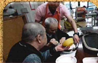
男性も率先して料理に参加