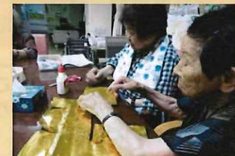
金の折り紙を貼ります