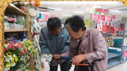
『これなんかいいんじゃない?』