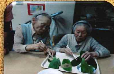
出来上がりまであと少し