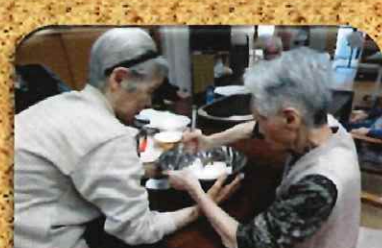
手際よく...協力して...