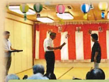
ボランティアさんの表彰式

8月7日（火）妙高の里「夏祭り」を開催しました。若葉会の皆様による踊り・大抽選会・大勢の皆様が足を運んでくださいました。ボランティアの方々のご協力もあり大盛況の中終わることができました。皆様のご協力に感謝いたします。