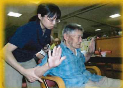
円背矯正のための運動

日常生活を営むのに必要な機能の減退を防止するための訓練。住み慣れた地域で生活が送れるように目標設定や計画を作成し、身体機能や生活力の維持・向上を目指します。