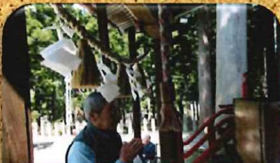
関山神社の至宝展にて

リハビリ効果という視点に立ち、外出することの楽しみを提供し、生きがいを実感していただきます。