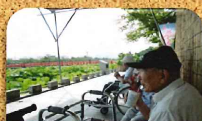
蓮を見ながら、一息ついて...