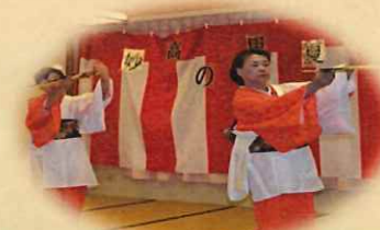
息の合った踊りでした。