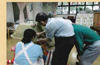
屋根の形が決まってきました。