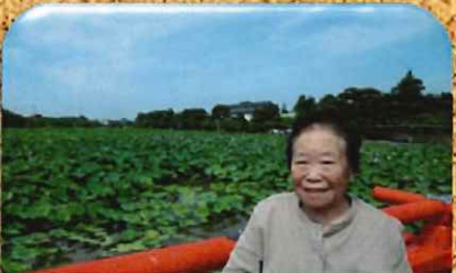
高田公園の蓮を見に行きました