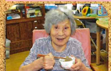
冷たくて美味しかった