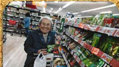
『お目当ての物が見つかったよ』