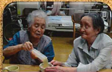
『はみ出ないように私押してるね』