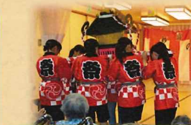
高校生が神輿を担いでくれました。