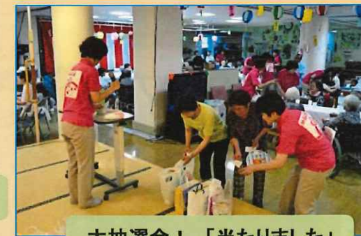
大抽選会！...「当たりました」