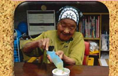
上手くつくことができました