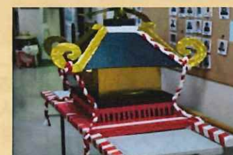
色も形もリニューアル！