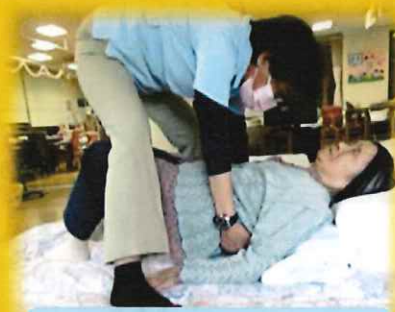
股関節の屈曲の運動