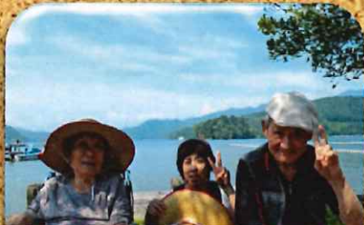
野尻湖をバックに、ハイポーズ