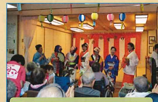
盛り上がった若葉会さんの踊り