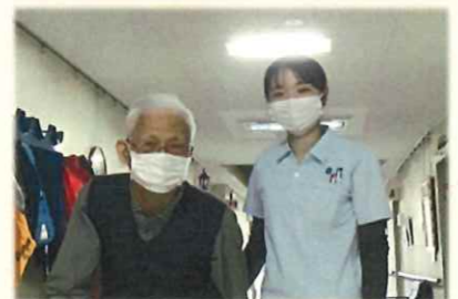
岩澤機能訓練指導員

機能訓練等で皆様と関わる時には研修内容を活かし、「ありがとう」の言葉をたくさんいただいています。