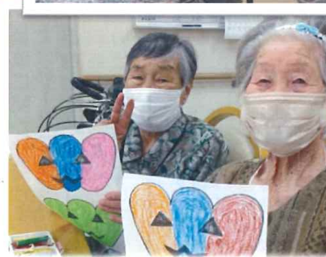
試行錯誤で一緒に完成させました。