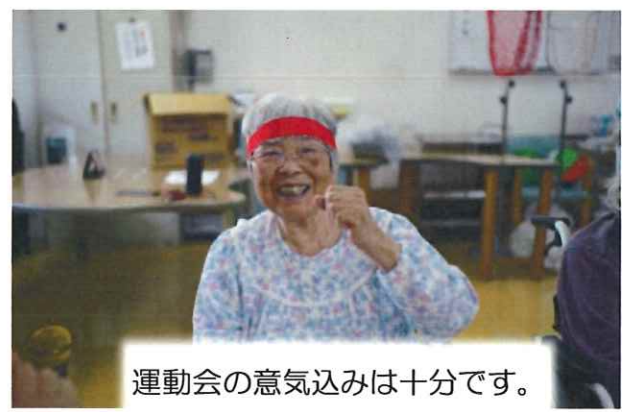
運動会の意気込みは十分です。