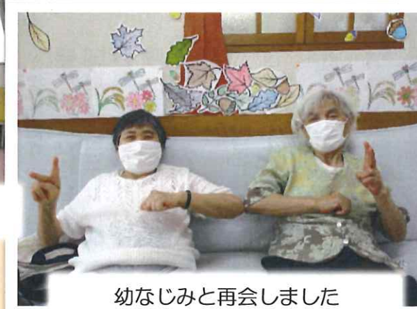
幼なじみと再会しました