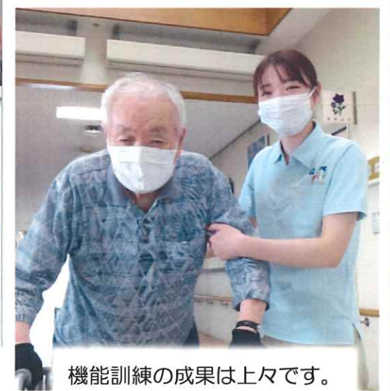
機能訓練の成果は上々です。