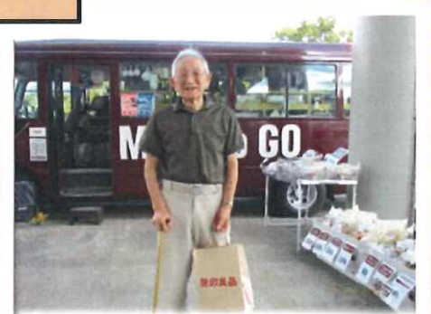
無印良品移動販売でお買い物