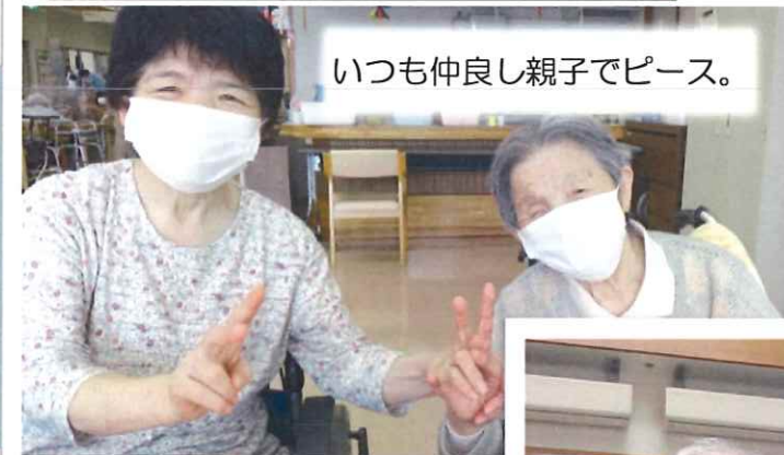
いつも仲よし親子でピース。