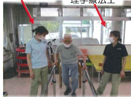
ショートステイと連携し 楽しみながら機能訓練