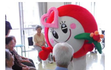
新井頰南福祉会イメージキャラクター けいなん愛ちゃん