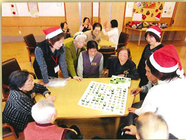
◀写真中央 ボランティアによる「げんきか〜い」 ▼写真下左 あらいまつり見学 ▼写真下中央 畑作業の様子 ▼写真下右 笹寿司作り

■ぬくもりサービス（有料）では、通院時の送迎、買い物の同行・代行、食事の居室配膳など、入居者様のご希望のサービスを提供いたしました。