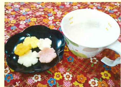
おやつは定番の 雛あられ!