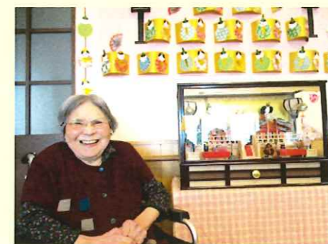
ひな人形を 観賞しました!