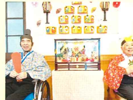
お内裏様とお雛様〜♪