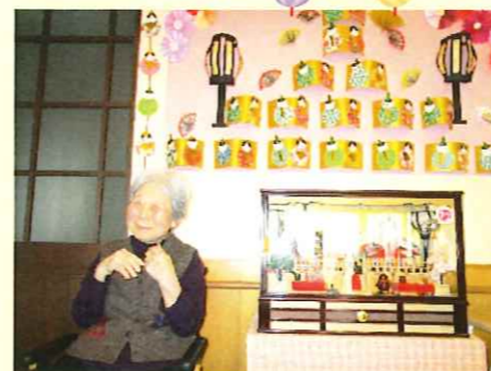
ひな人形可愛いね!