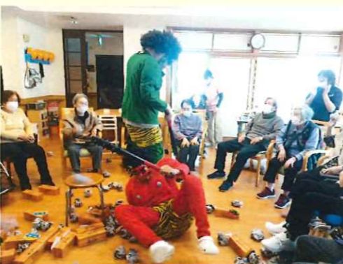
鬼をやっつけろー!