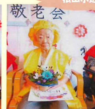
松山水辺公園ドライブ