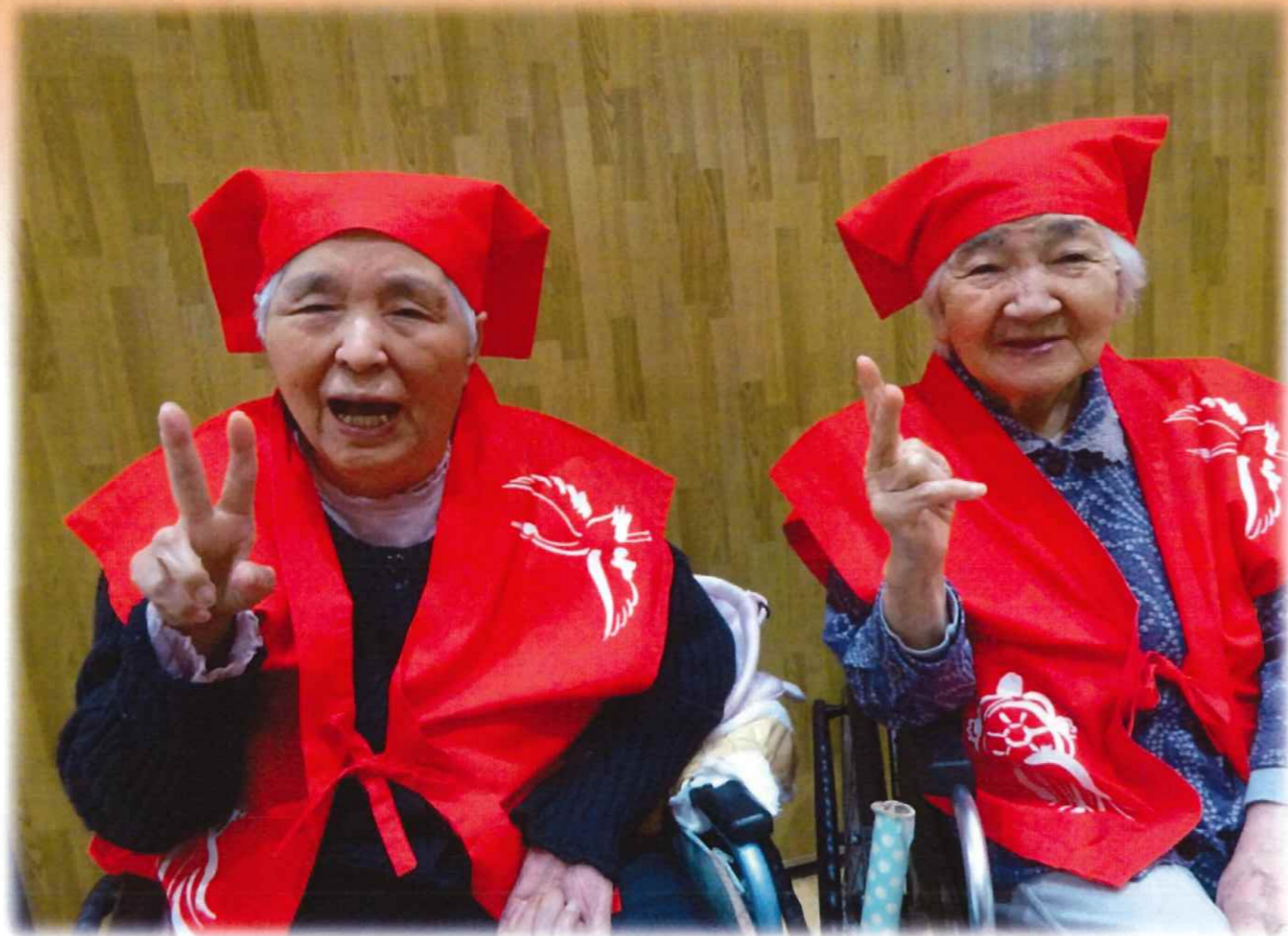
表紙の写真は、敬老の日に賀寿を記念して一枚！素敵な笑顔のお二人です。

日頃より、名香山苑の事業にご理解とご協力をいただき誠にありがとうございます。ご利用者の素敵な表情とともに、各事業の活動の様子をご覧ください。