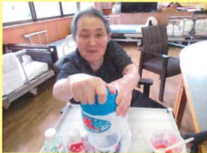
かき氷美味しかったね