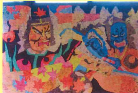
ねぶた祭りの貼り絵