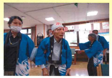
妙高高原音頭盆踊り

「夏」を満喫出来るように活動を企画し、「ご利用者に楽しんでいただきました。」 手工芸ではたくさんの方の色紙を下絵に合う形に切って「青森のねぶた祭り」風の迫力ある壁画が完成しました。 七月は夏祭りをを行い、輪投げ大会と盆踊りで楽しいひと時を過ごしました。 輪投げ大会ではメダルと豪華景品もあり、「肩の痛いのも忘れて夢中で投げたわね」と笑顔でお話される方や、盆踊りでは地元のみ謡に合わせて輪になり踊り「昔、婦人会で沢山踊ったわ。」と自然に体を動かし職員に踊り方を教えてくださる場面もありました。 八月にはかき氷作りやスイカ割りも盛大に行われ、笑顔と笑いの絶えない時間を皆で共有できました。