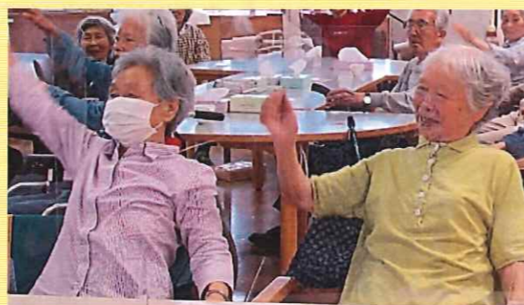
水泳競技、背泳ぎしています！