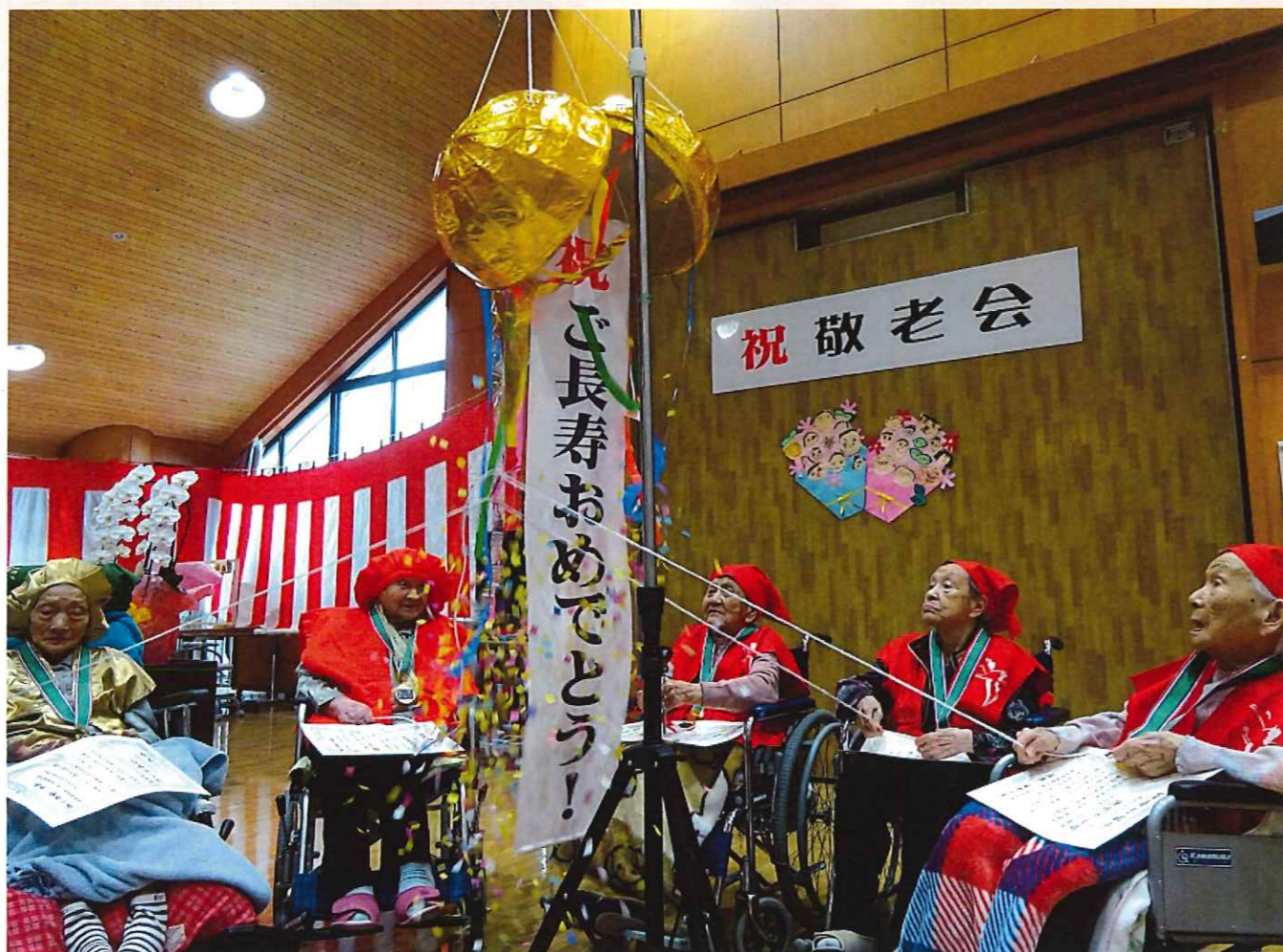
敬老会の様子です。職員一同で長寿のお祝いをさせていただきました。賀寿者の方々にくす玉を引っ張っていただき、上手に割れました。これからも元気にお過ごしください。おめでとうございます！

日頃より、名香山苑の事業にご理解とご協力をいただき誠にありがとうございます。 ご利用者の素敵な表情とともに、各事業の活動の様子をご覧ください。