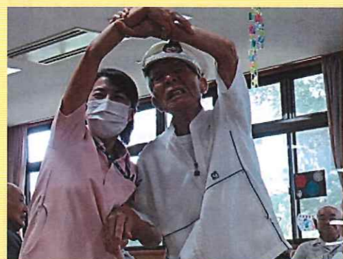
アーティスティックスイミング！！

今年の夏は東京オリンピック・パラリンピックを通して選手から沢山の勇気と感動をもらいました。 デイサービスでは7月から手芸の時間に貼り絵を行いました。写真の「2021」の文字は世界の国旗を一枚ずつ切り取り、貼り付けた作品です。 レクリエーションの時間に世界各国の名前やオリンピック・パラリンピック競技のピンゴゲームで脳の活性化を図りました。また、体操を兼ねた機能訓練では各競技の動きを真似て身体を動かしました。水泳では職員が水中眼鏡を装着し、利用者の皆さんの笑顔や笑い声が絶えませんでした。 これからの季節。オリンピック・パラリンピックの余韻を楽しみながら、利用者の皆さんと身体を動かしながら「スポーツの秋」を満喫したいと思います。