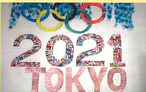
ちぎり絵頑張りました！

今年の夏は東京オリンピック・パラリンピックを通して選手から沢山の勇気と感動をもらいました。 デイサービスでは7月から手芸の時間に貼り絵を行いました。写真の「2021」の文字は世界の国旗を一枚ずつ切り取り、貼り付けた作品です。 レクリエーションの時間に世界各国の名前やオリンピック・パラリンピック競技のピンゴゲームで脳の活性化を図りました。また、体操を兼ねた機能訓練では各競技の動きを真似て身体を動かしました。水泳では職員が水中眼鏡を装着し、利用者の皆さんの笑顔や笑い声が絶えませんでした。 これからの季節。オリンピック・パラリンピックの余韻を楽しみながら、利用者の皆さんと身体を動かしながら「スポーツの秋」を満喫したいと思います。