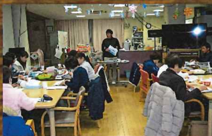
認知症の人の尊厳を考える研修

妙高の里では、昨年度も10項目の全体研修を実施しました。毎回全職員が意欲的に参加し、サービスに生かせる知識を深めました。