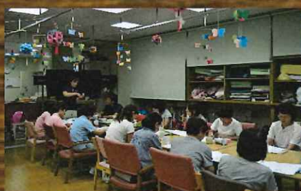
歯科衛生士による口腔ケア研修